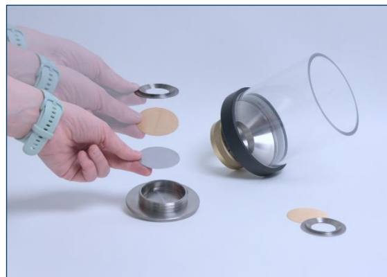
Wkładanie płytki ścierniej i sitka ściernego